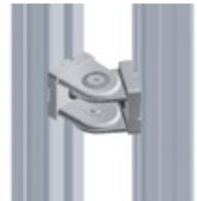
Gelenk 38/ 1,5" Pivot Joint 38/ 1.5"